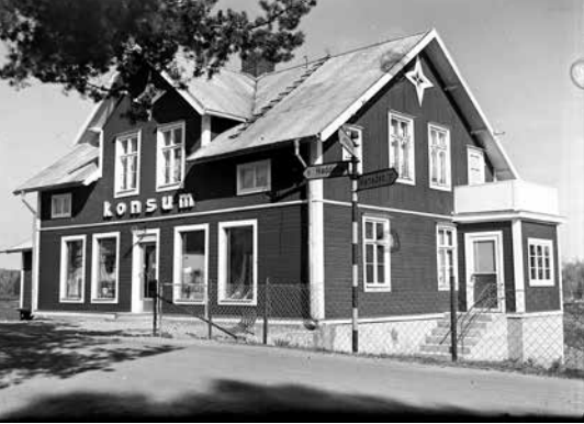
Konsumaffären på den tiden man fick handla över disk.