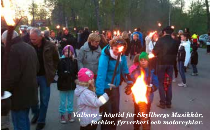
Valborg – högtid för Skyllbergs Musikkår, facklor, fyrverkeri och motocyklar.

Vilt & Delikatessboden. Ett annat bolag på orten är Widmarks El.