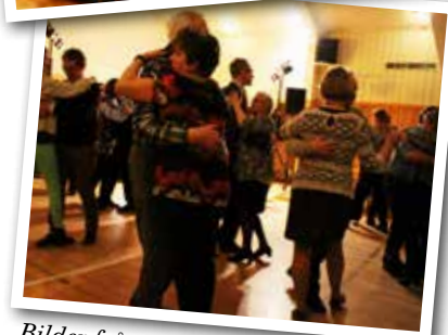
Bilder från danskvällen den 15 mars.