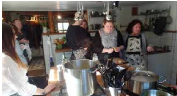
Några av kursdeltagarna i full färd med matlagningen.