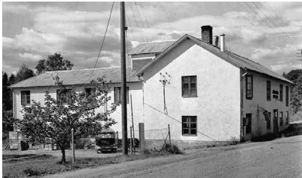
Mörtsjöns Bryggeri låg mellan Lerbäck och Gålsjö.

– Det hände ofta trevliga saker också. I Hallsberg hade vi en kund som varje gång vi kom bjöd på kaffe och smörgås. Och förutom det låg det varsin cigarett på höger sida om koppen trots att kunden själv inte rökte!