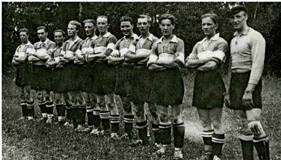
Fotbollsdressen har förändrats sedan 1930-talet.