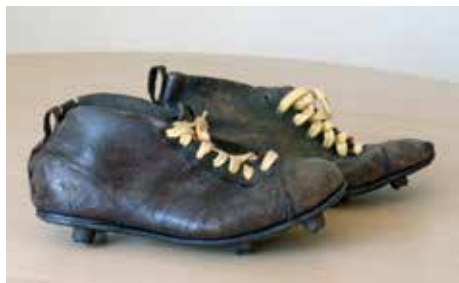
Fotbollsskor från tiden när det begav sig.