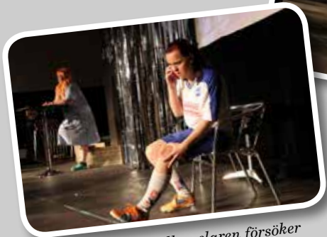
Den skadade fotbollsspelaren försöker ringa vården men hamnar hela tiden i telefonkö.