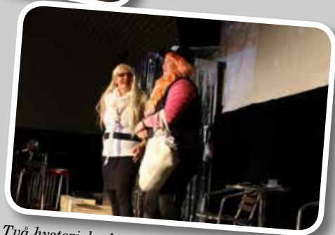
Två hysteriska bantningsfanatiker har svårt att välja mat.