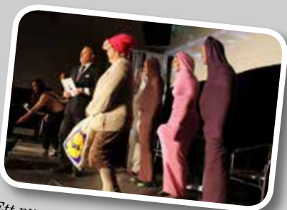
Ett nummer som drar ner extra stora ovationer är Sopfrälsning. Till låten Hooked on a feeling men med ny text framförs sopsorteringens lov och övergår så småningom i ett väckelsemöte, där "predikanten" uppmanar oss att sortera våra sopor.