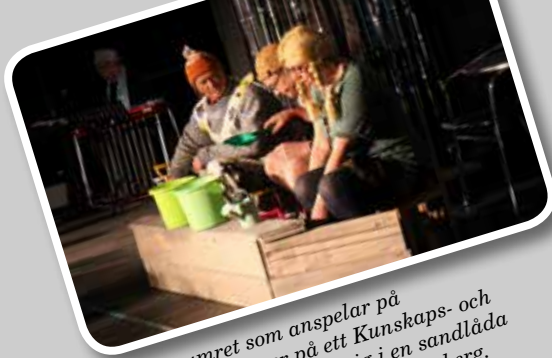
Första numret som anspelar på Askersunds planer på ett Kunskaps- och kulturcentrum utspelar sig i en sandlåda där "barnen" bygger nytt i Närkesberg.