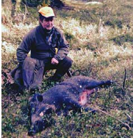
Artikelförfattaren med sitt nedlagda byte, en gylta.