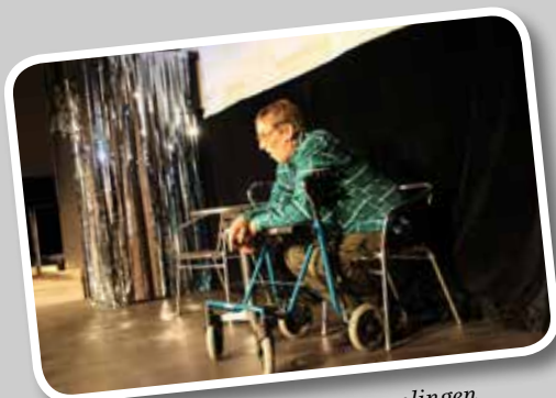
Det blir mycket smidigare för gamlingen när hemtjänsten dras in och ersätts av en dator.

Närkesberg har åter satt sitt namn på kartan tack vare revygänget. Ett gäng amatörer som mycket proffsigt och med stor spelglädje underhåller inte bara närkesbergare utan besökare långt utanför orten.