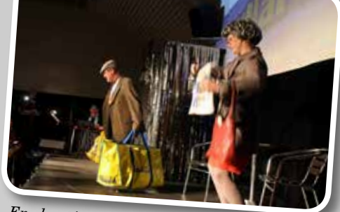
En shoppingresa till Ullared där maken är med för att bära kassarna.

Inför fullsatt hus framför Närkesbergsrevyn en bejublad föreställning, där man kan se revynummer som häcklar företeelser i dagens moderna samhälle. Till exempel kunden som inte längre kan få hjälp på banken, hemtjänsten som ersätts med en dator och problem med att komma fram i sjukvårdens telefonkö.