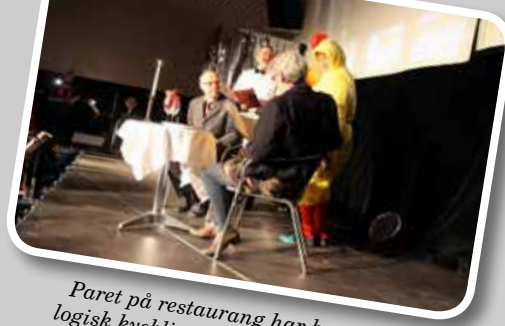
Paret på restaurang har beställt ekologisk kyckling och servitören försöker övertyga dem om att kycklingen är närproducerad, trots att "kycklingen" bryter på danska.