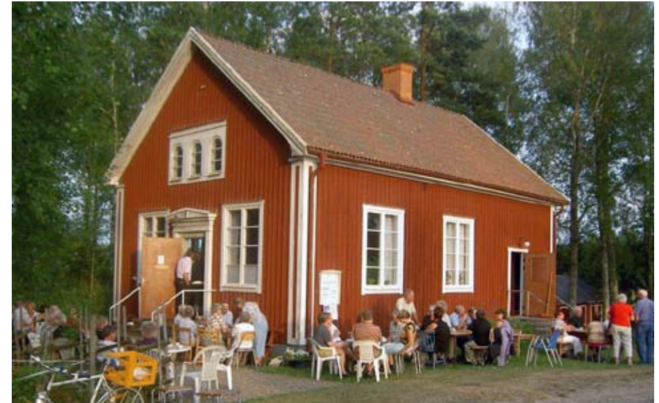
Sommarcaféet Qvarnån erbjuder trivsamt samvaro och kaffe med hembakt bröd.

Besök Närkesberg 070-5793645, e-post besok.narkesberg@hotmail.com