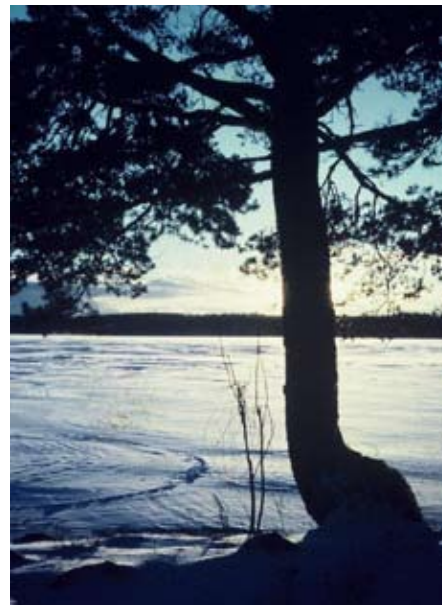
I Storsjön startar en av Sveriges vackraste kanoturer.

Den är en av våra vackraste byar, denna Närkesbergs "Bullerby", skönt belägen på en söderslänt. Färfarmaren Gudrun tar emot i sin butik med stort sortiment av skinn- och ullprodukter från den egna lammproduktionen. På sjön Örgaveln kan vi också erbjuda flottfärd för upp till 20 personer.