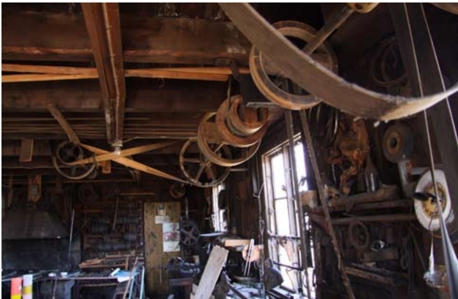
Närkesbergssmedjans kombination av smide och finsnickeri var unik på sin tid.