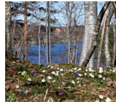
Vår i naturresevatet Kopparbergs äng.

Kopparbergs äng är ett litet naturskönt resevat i en sluttning med utsikt över Hjertasjön. I naturresevatet finns betesmark, slåtteräng och ädellövskog. Floran är rik och här finns många spår av forna tiders människor; tjärdalar, odlingsrösen och brukningsvägar. Särskilt intressanta är Trefaldighetskällorna. Fram till femtioalet samlades bygdens folk till festlighet här på pingstdagen, en tradition med långa anor, kanske från medeltiden. Fortfarande samlas man på ängen vid naturresevatet varje pingstshelg. Vid resevatet finns restaurang och café samt en butik med ekologiska produkter.