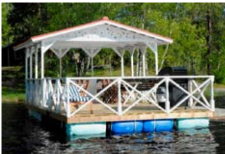
Vi erbjuder en flottfärd på upp till tre timmar runt sjön, bland annat till Brudberget och Tattarsundet. Vi kan servera kaffe eller grillbuffé. Det finns också möjlighet att ta med egen mat.

Bergshanteringen dominerade bygden under flera sekel. 1800-talet präglades av jordbruk och hantverk. Idag dominerar småföretagsverksamhet. Det finns påtagliga spår och minnesmärken från hela denna fantastiska utveckling. Besök Närkesberg kan erbjuda guidade kulturhistoriska vandringar och byavandringar specialarrangerade för besöksgrupper.